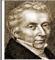
Thomas Mun 1571 - 1641

...Là những thương gia hay thành viên của chính phủ