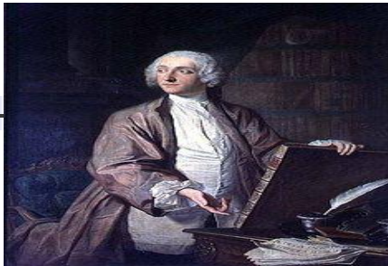
Antoine De Montchrestien (1575-1622)

- Đối với việc làm tại Anh: Sự nghèo nàn chính là câu trả lời: "bần hàn và thiếu thốn", ông viết: "hoang dã khiến cho người ta thông minh và chăm chỉ".